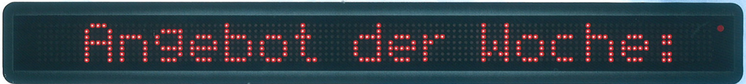
TL 520 R

Flughäfen · Nachrichtenzentralen · Bahn- und Busbahnhöfen · Banken · Hotels