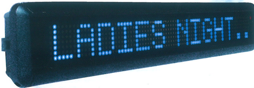
TL 513 BSH